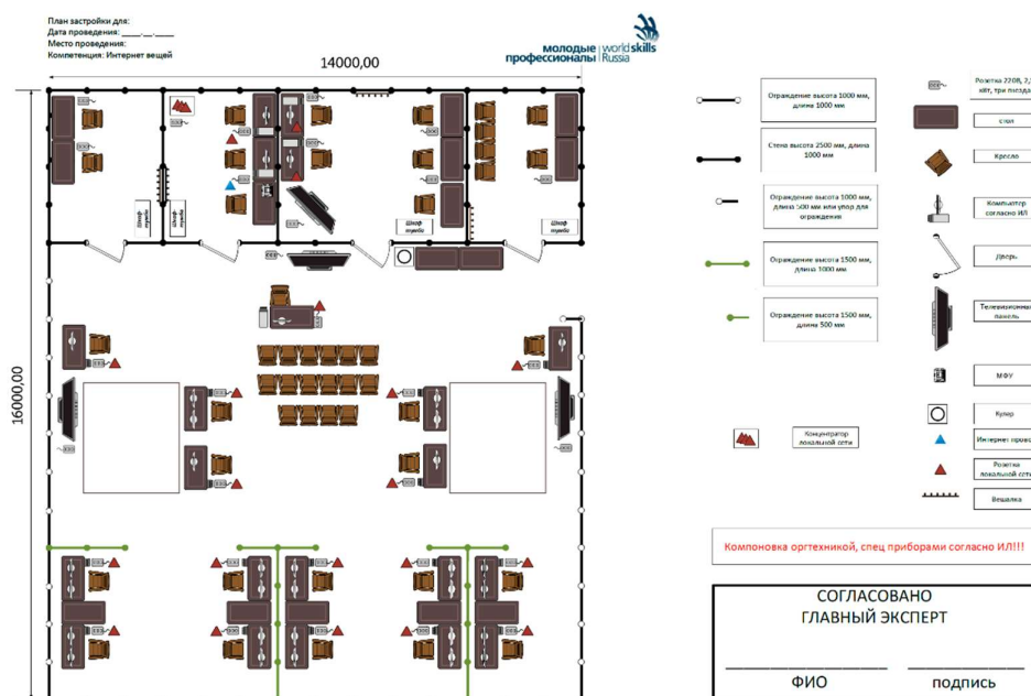
Рисунок 2. Схема конкурсной площадки

В комнатах экспертов необходимо установить запираемые шкафы для хранения ценных вещей участников и экспертов.